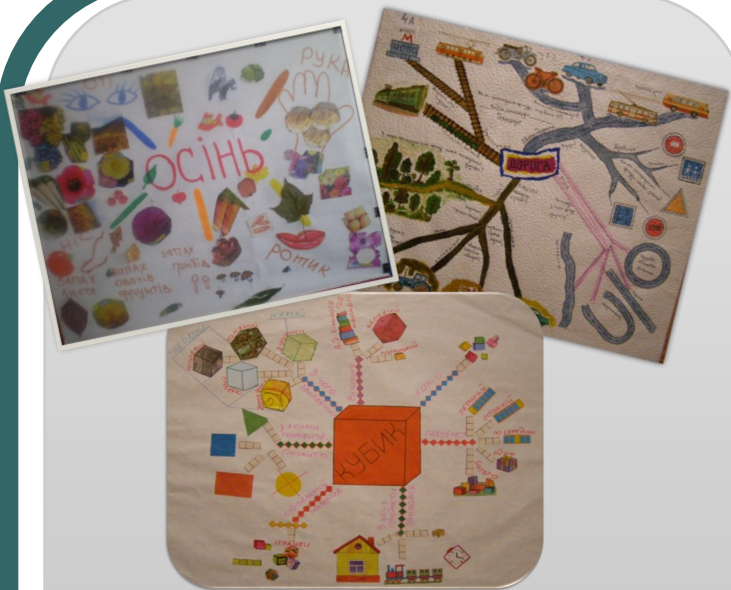
Приклади інтелектуальних карт